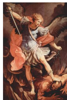
Guido Reni's impressie van aartsengel Michaël (geschilderd te Rome).