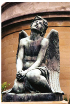
Engel bij een grafzerk