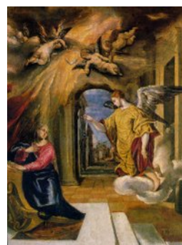
De annunciatie - El Greco