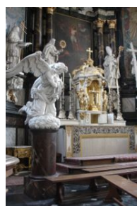
Johannes Boecksent; Knielende Engel

Het woord engel stamt af van het Latijnse angelus , wat zelf afgeleid is van het Griekse ἄγγελος, ángelos , wat allebei "boodschapper" betekent.