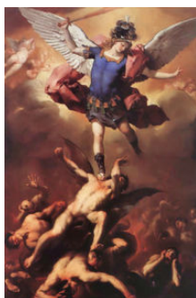
Luca Giordano, de val van de opstandige Engelen