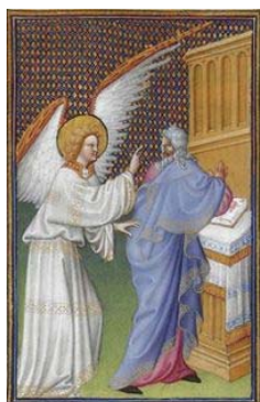
De aartsengel Gabriël verschijnt aan Zacharias (interpretatie van de schilder Paul de Limbourg , zie Gebroeders Van Limburg )